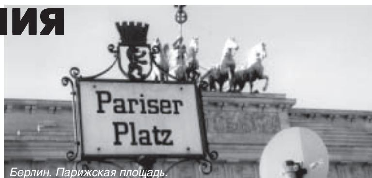
Берлин. Парижская площадь.

Участники коллоквиума в Берлине сошлись также во мнении, что необходимо уделить больше внимания изучению «уже заявленных стратегических интересов США в Евразии, так как в обозримом будущем здесь может возникнуть